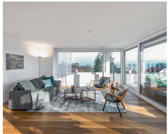
Nach dem Home Staging.